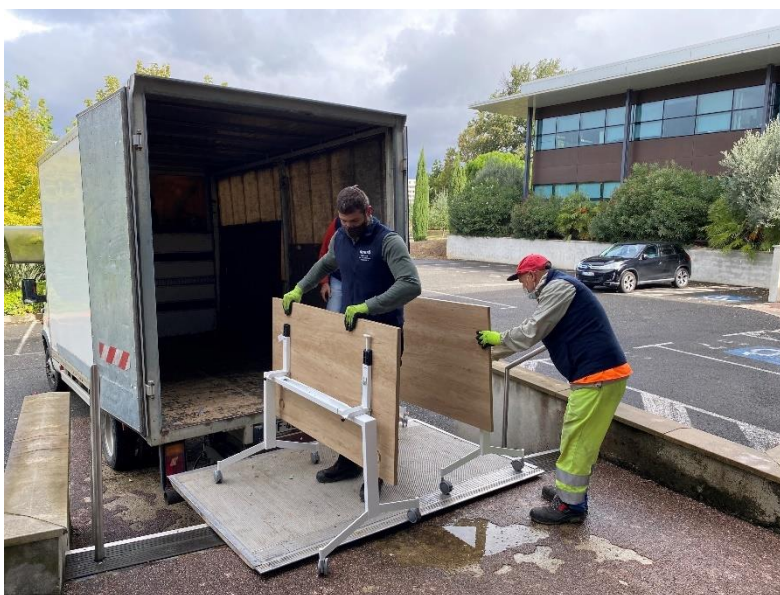
Intervention manutention par l'équipe des Rudovaloristes (31)

Parmi les plus de 180 partenaires du Réemploi et de la Réutilisation de mobilier professionnels, nous comptons de plus en plus de compétences complémentaires, de moyens techniques, capacités logistiques et besoins variés. Valdelia s'engage à solliciter au mieux chaque partenaire en complémentarité, de manière équitable et cohérente du point de vue environnemental pour maximiser la seconde vie sur tous les chantiers où cela est possible. A l'heure actuelle, certaines entreprises d'insertion du réseau réalisent déjà des prestations de manutention pour organiser le don d'autres associations partenaires n'ayant pas les mêmes finalités et moyens techniques.